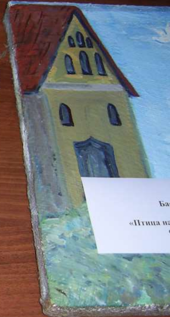
Ба... «Птица на...»