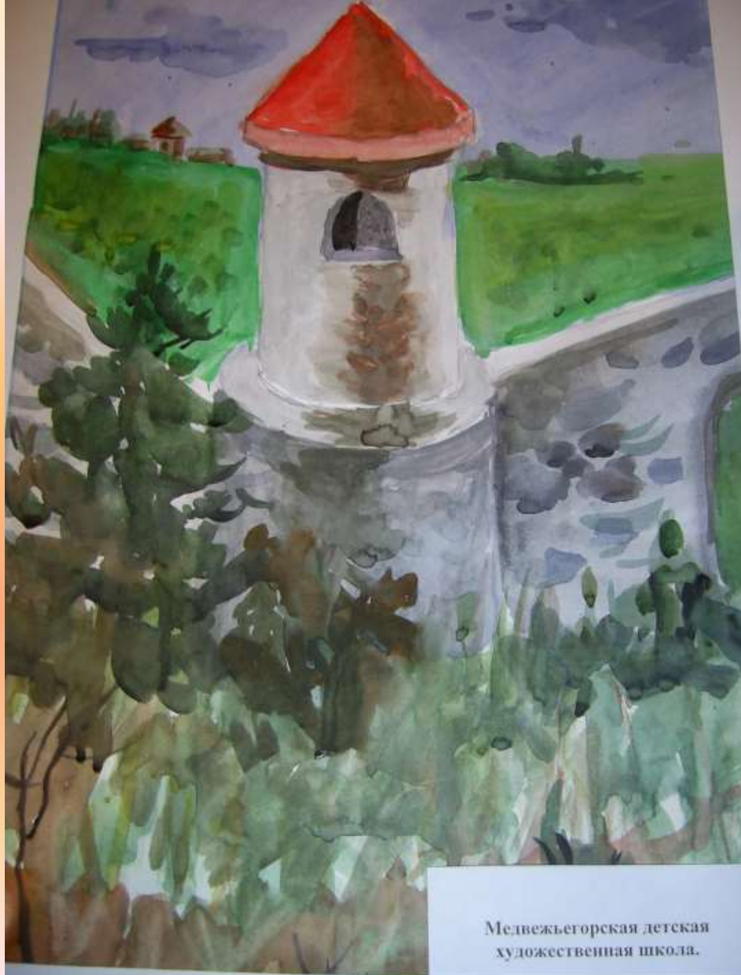
Медвежьегорская детская художественная школа.