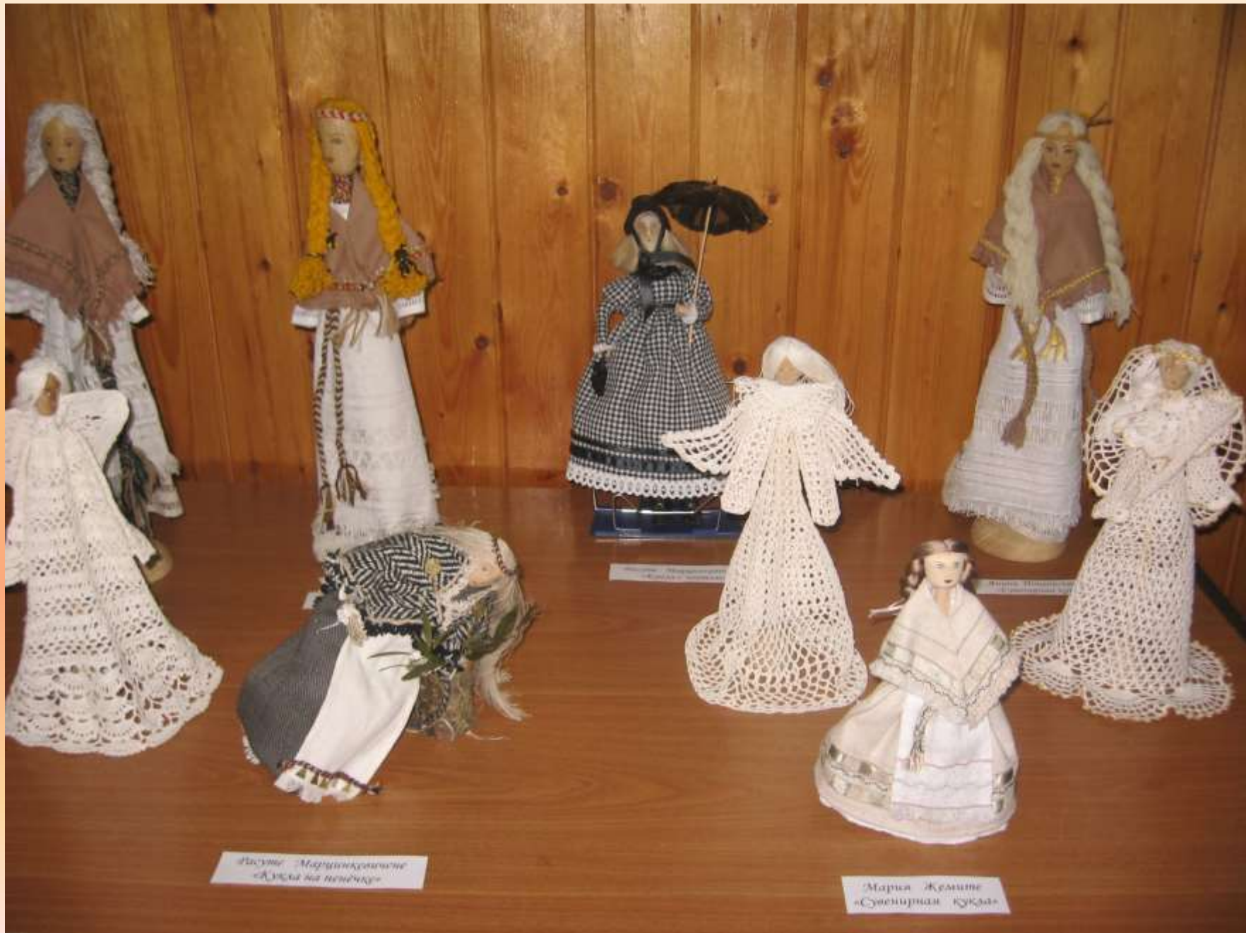
Пасице Марица Кочевине «Алце на пенџеро»