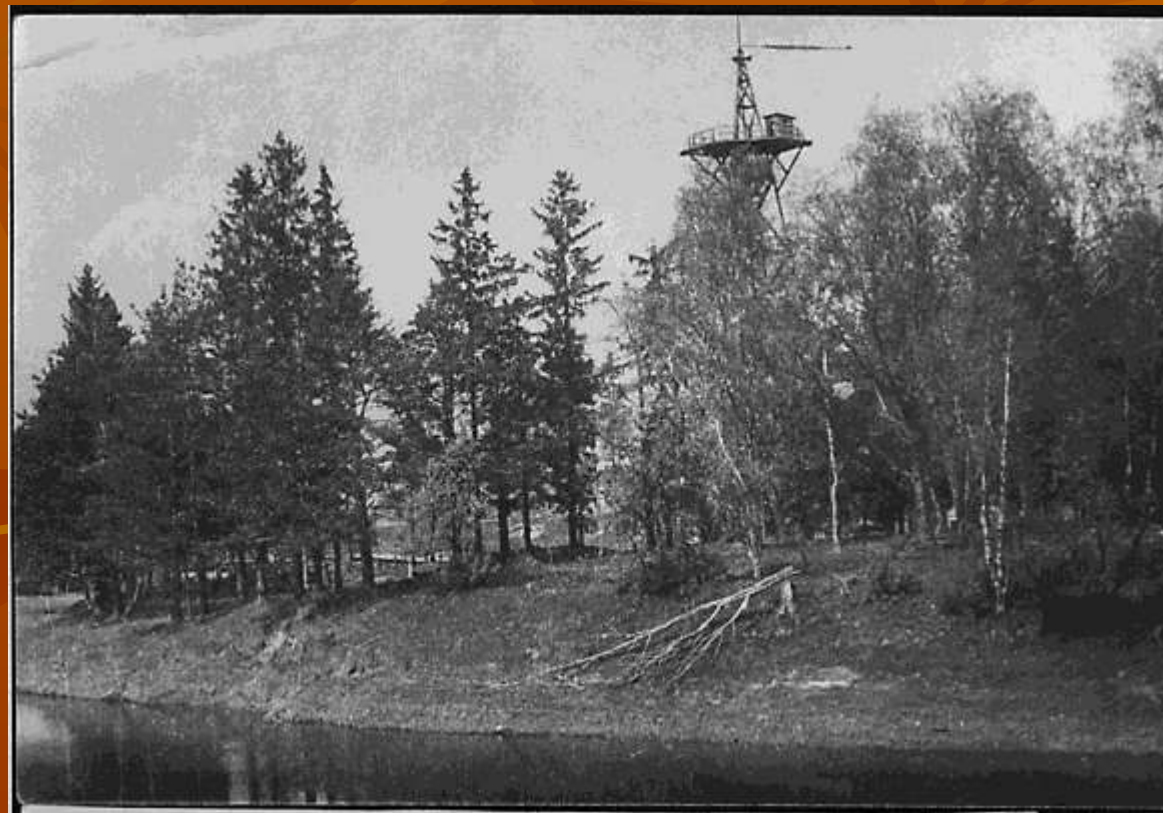
Парашютная вышка в городском парке (50-е годы) (ныне не существует)

В блоке «Олонец советский» предлагается совершить фото-путешествие в эпоху 40-80-х годов XX столетия.