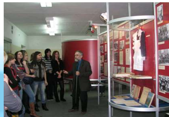
Музей истории народного образования РК