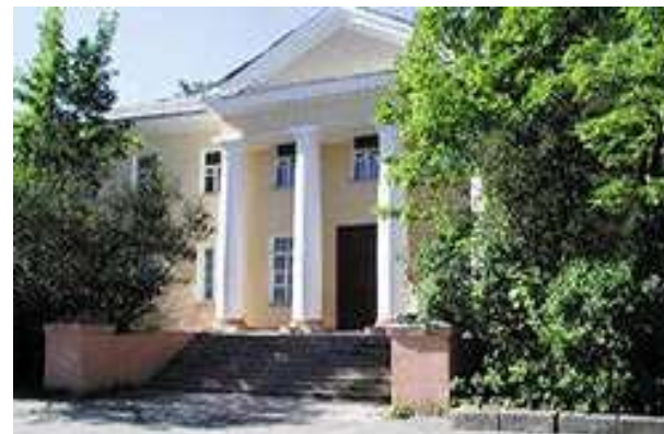
Национальный музей РК