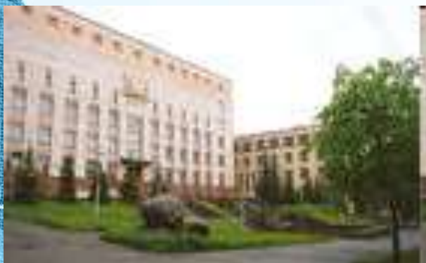
Карельский научный центр