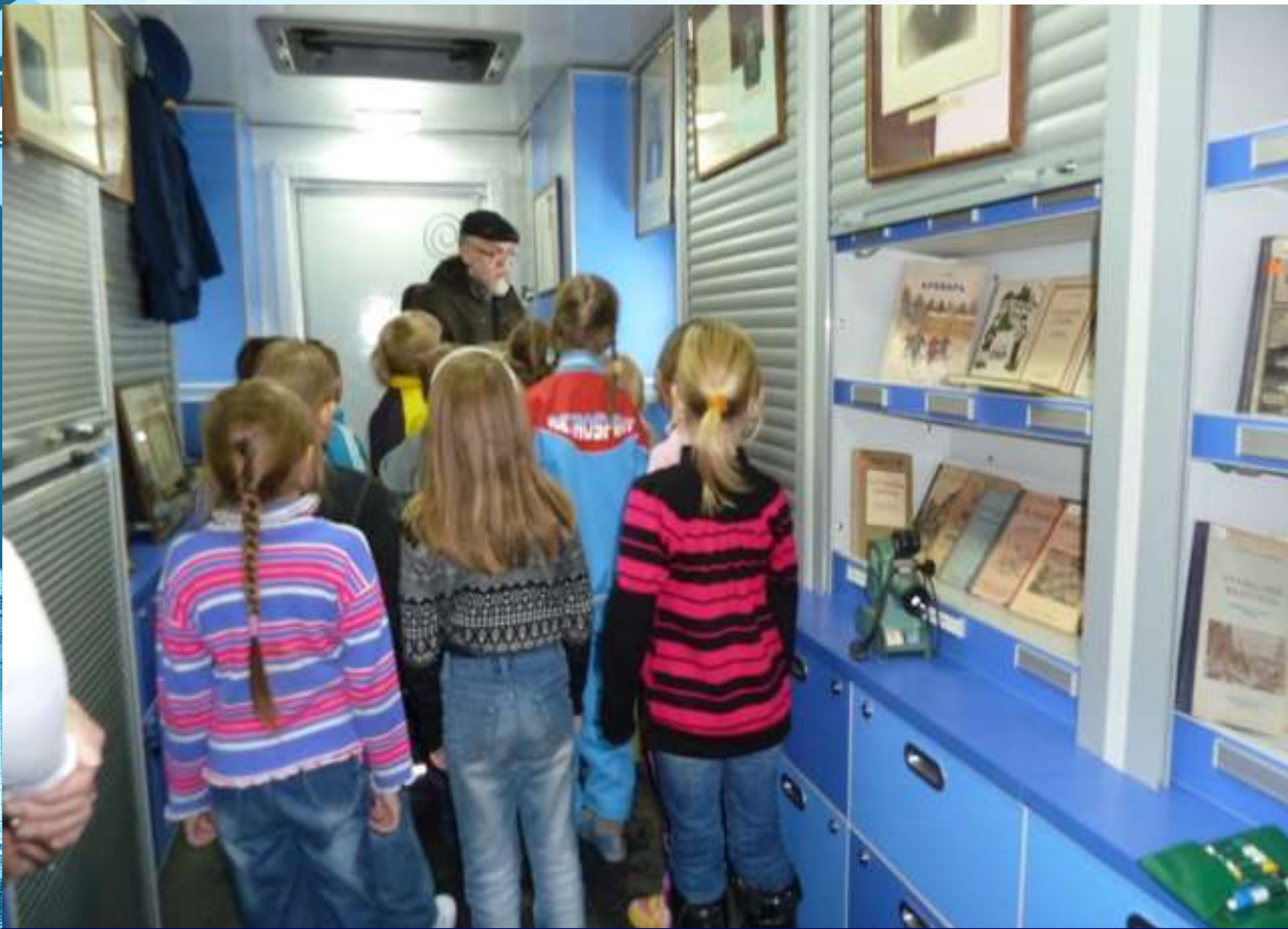
Экскурсия по выставке «Документы эпохи: из истории народного образования XX век.» проводит директор Музея истории народного образования РК