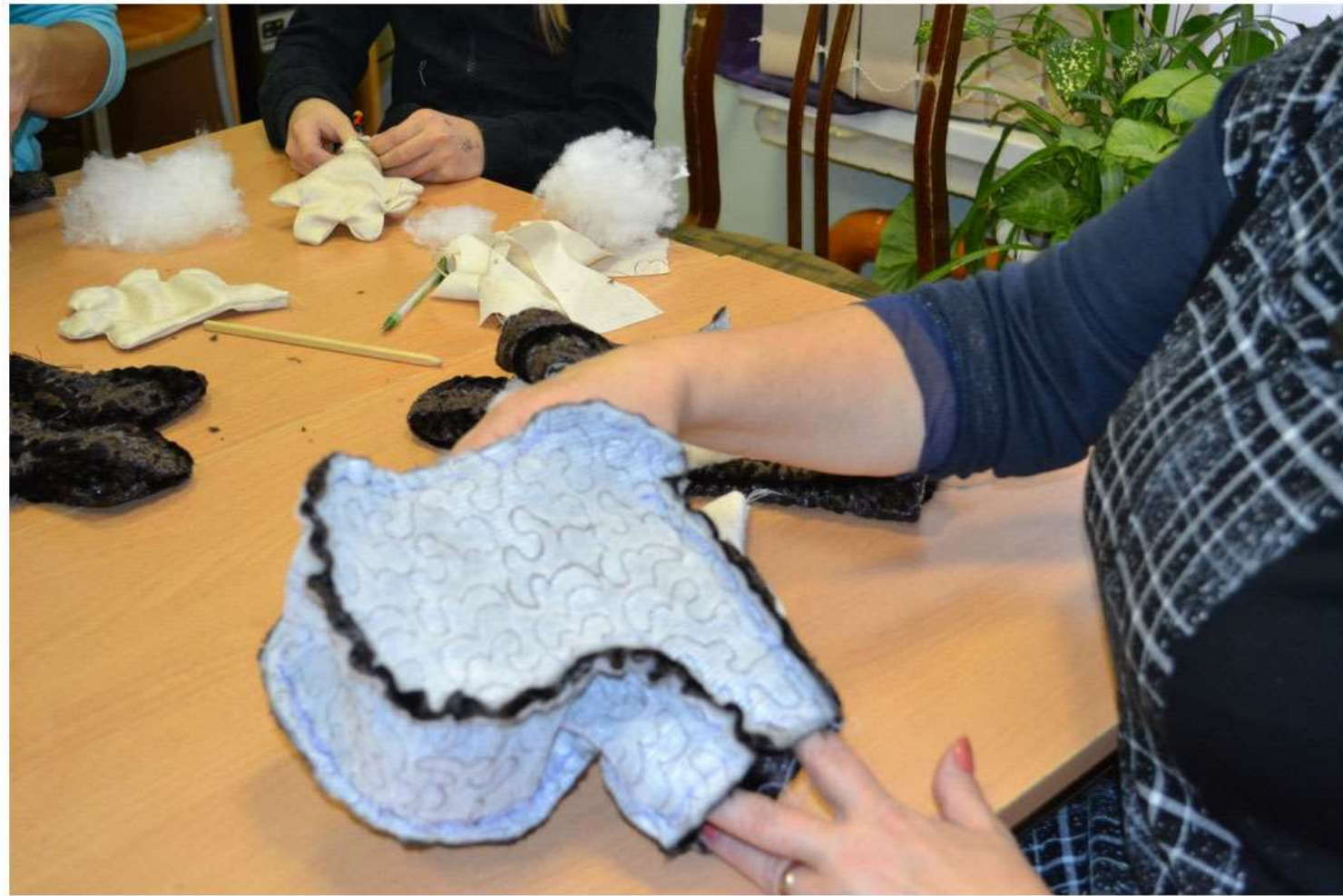
Нижняя часть головы не прошивается. Добавлена 18 ноября 2013 | Указать место | Мне нравится

Альбом: Мастерская кукол: сезон карельской сказки. Альбом №95