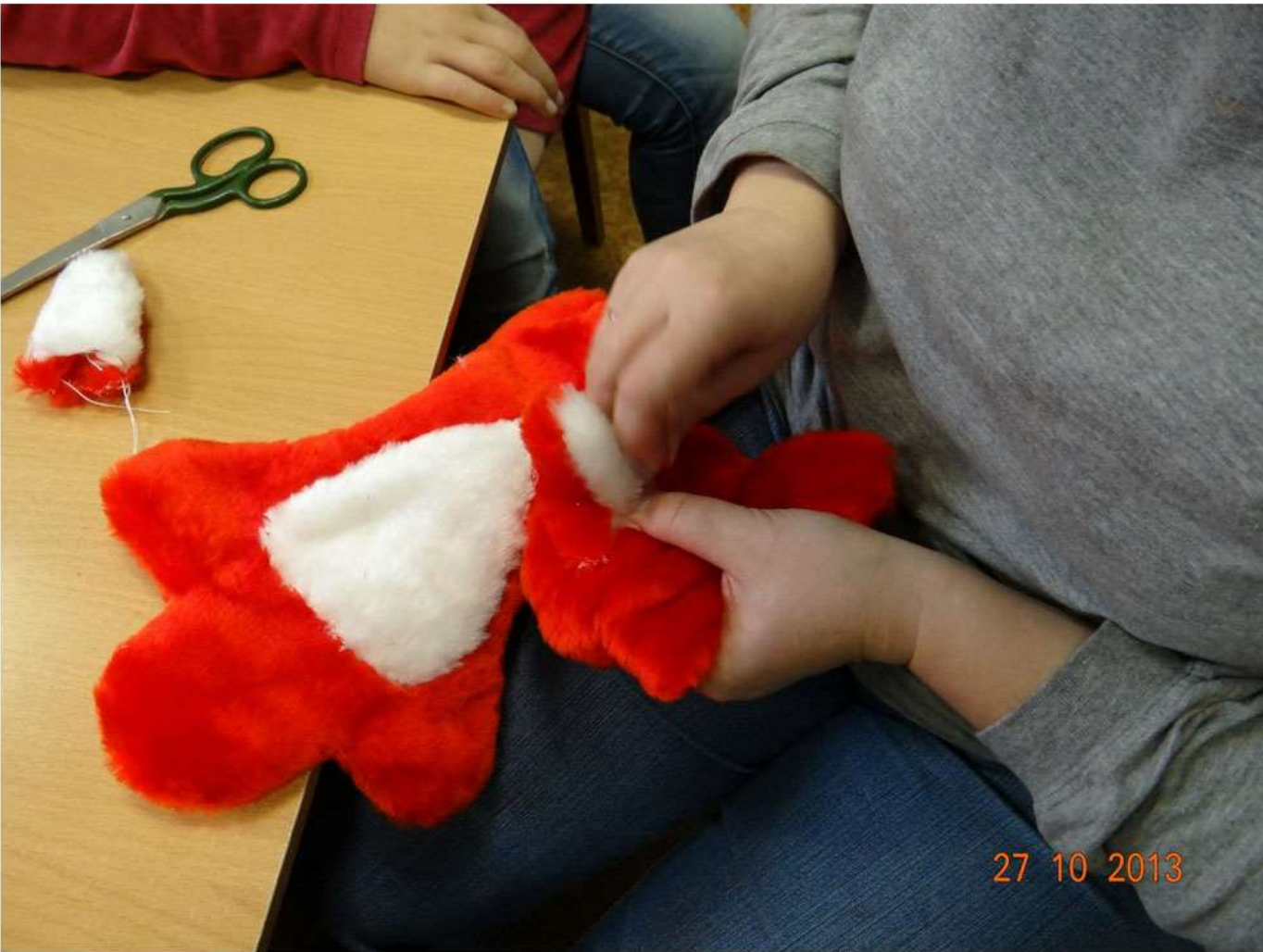
К туловищу лисички можно пришить белую грудку размером примерно 13 см x 11 см. Шьем потайным швом, не загибая края грудки. С помощью ворса шов можно сделать незаметным.

Альбом: "Мастерская кукол: карельские сказки" Альбом..