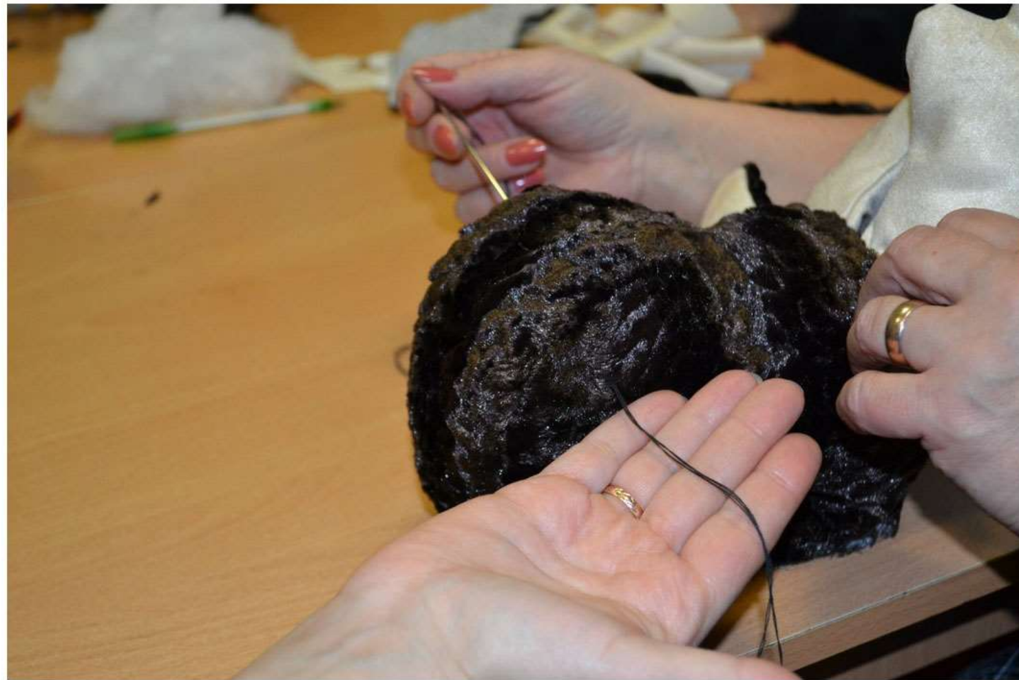
Наметьте место, где будут у лося ноздри. Добавлена 18 ноября 2013 | Указать место | Мне нравится

Альбом: Мастерская кукол: сезон карельской сказки. Альбом №95