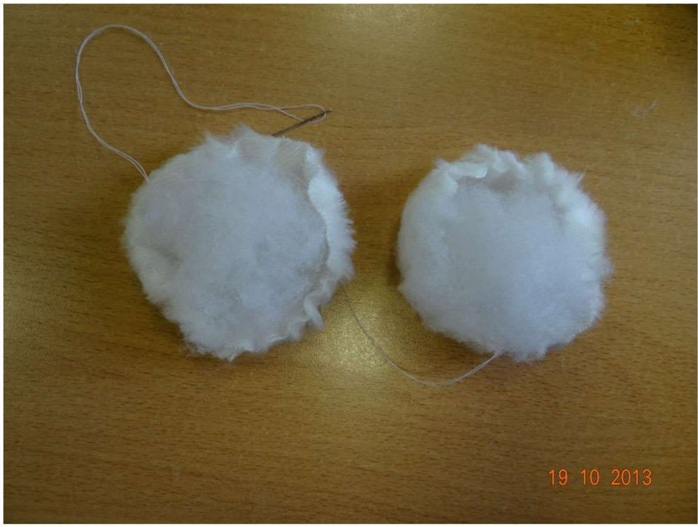
Детали для щек стяните по краям ниткой и заполните их синтепоном. Добавлена 23 октября 2013 | Указать место | Мне нравится

Альбом: "Мастерская кукол: карельские сказки" Альбом..