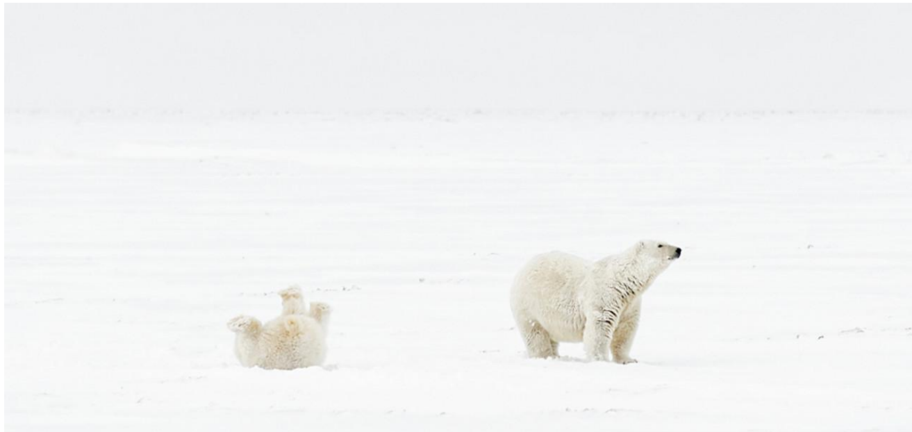
3 Напоq3-1

Фотографии были отобраны куратором Пиркко Сиитари, и их темы варьируются от критического анализа мира до поэтической действительности.