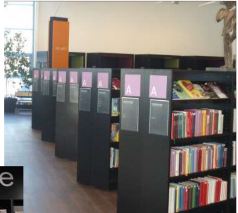
Библиотека Оулункюля, Хельсинки