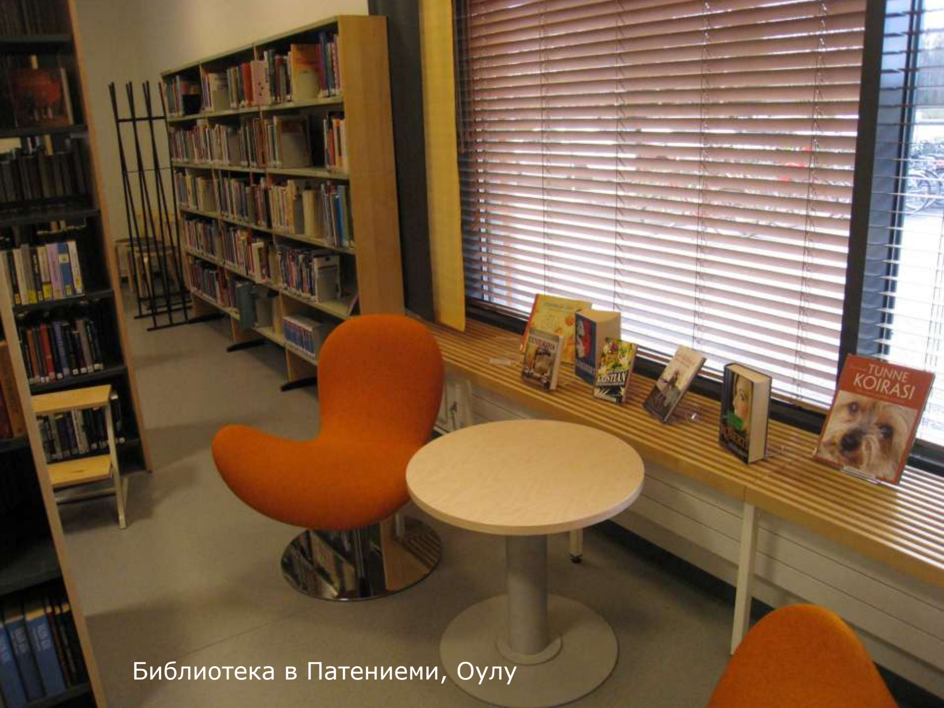
Библиотека в Патениеми, Оулу