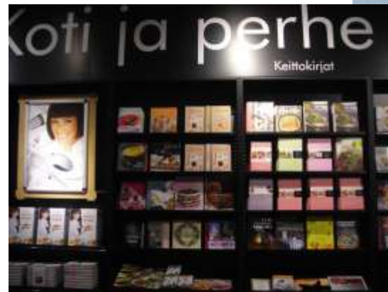
Финский книжный магазин, г. Куопио