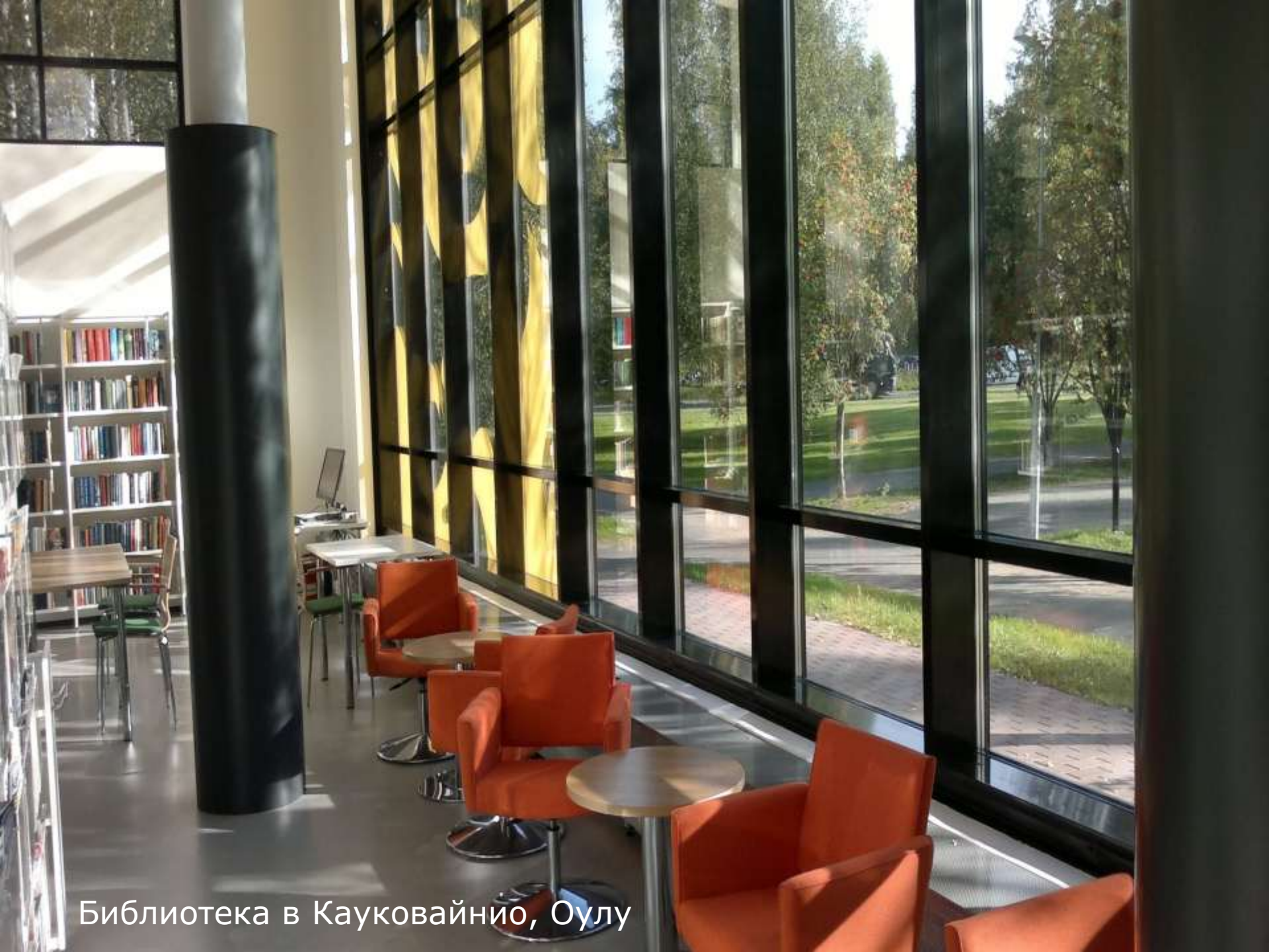
Библиотека в Кауковайнио, Оулу