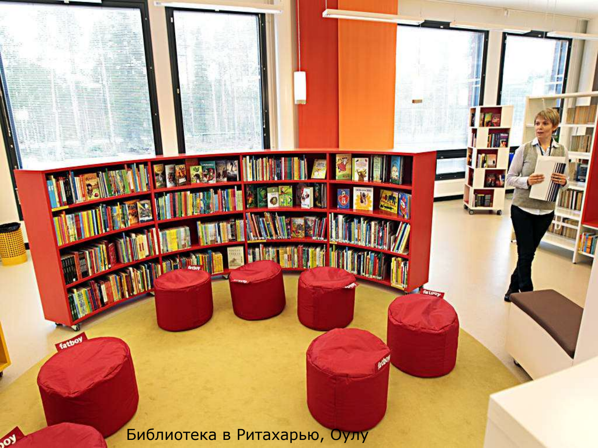
Библиотека в Ритахарью, Оулу