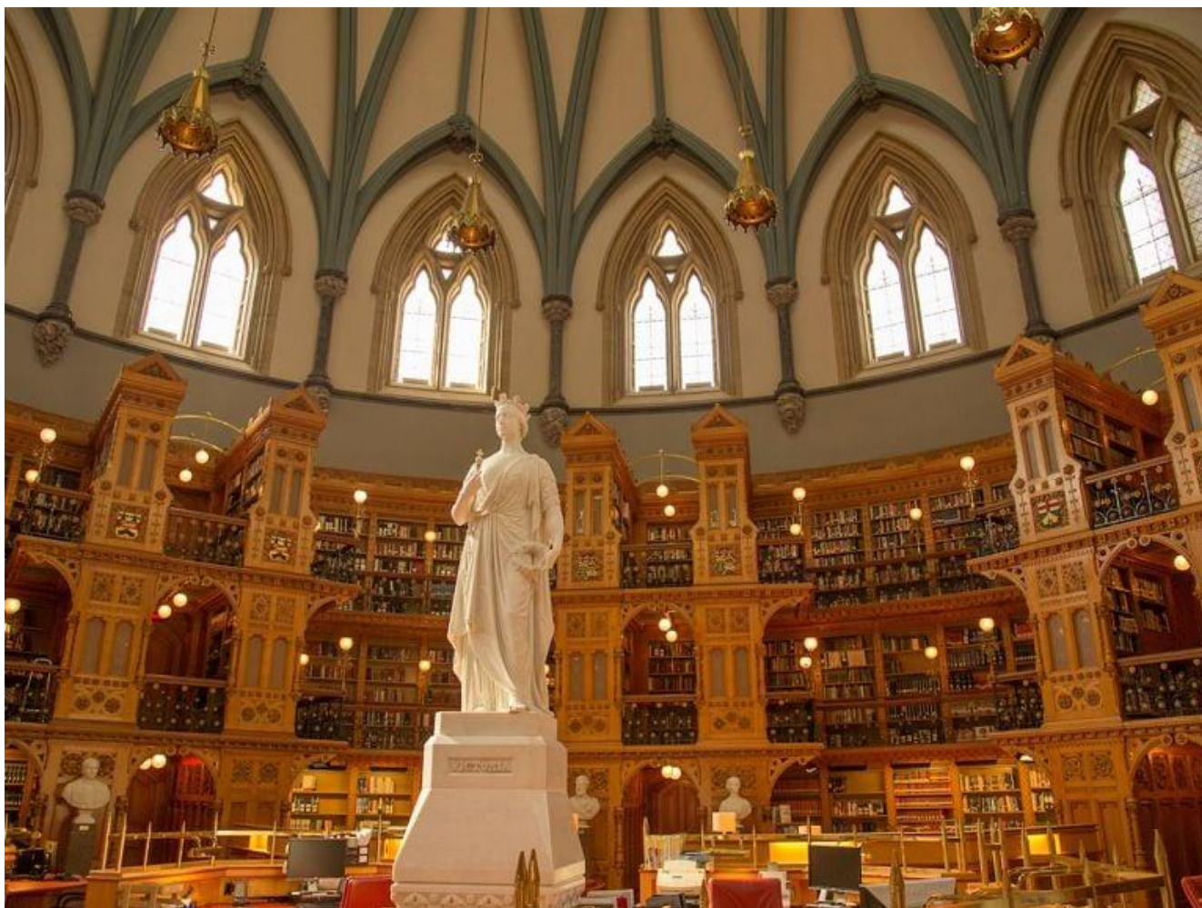
Центральный блок Парламентского холма – Оттава, Онтарио, Канада