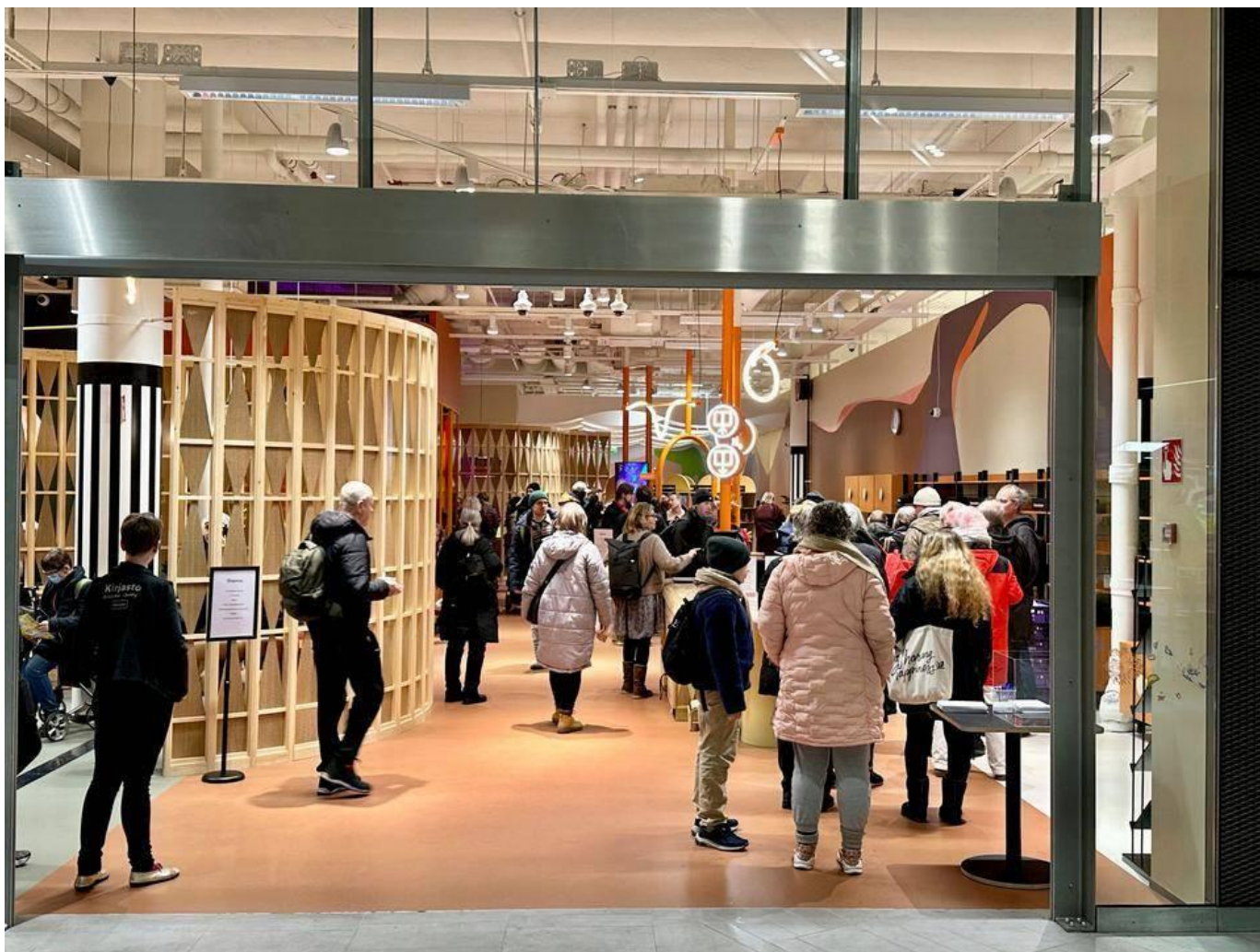
Библиотека Каласатама по размеру такая же, как библиотеки Херттониemi и Маунула. Аapo Сииппайнен

– Для выставок отобран разнообразный и многоплановый материал, и, например, в связи с тем, что район Каласатама расположен на берегу моря, мы предлагаем также книги морской тематики. Темы также могут предлагать посетители. Меньший размер имеют, например, библиотеки в районах Суоменлинна, Похьойс-Хаага, Ройхувуори, Мюллюпуру, Суутарила, Тапанила, Пуйстола, Кяпуля, Малминкартано, Пикку Хуопалахти и Яткясаари.