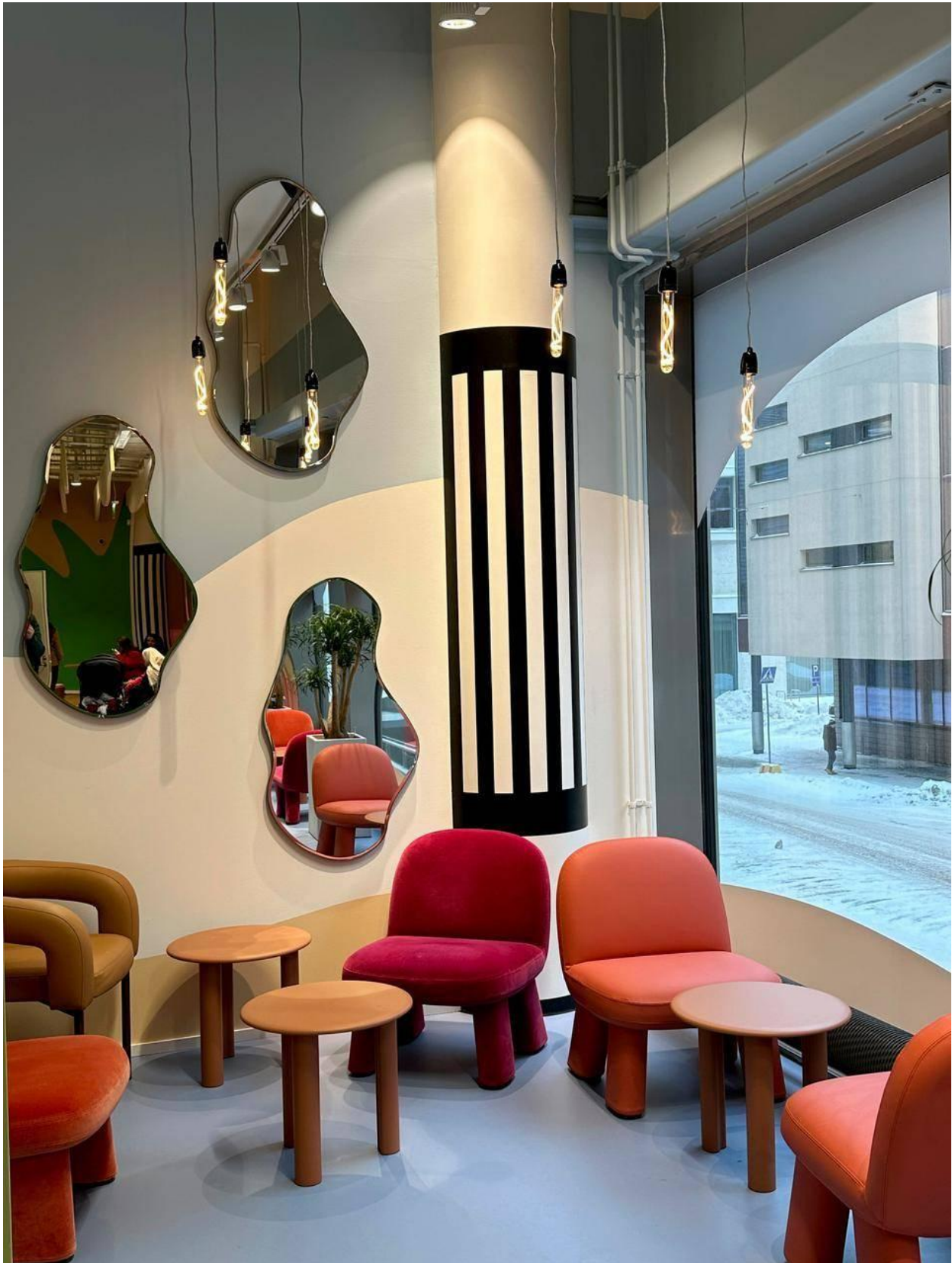
Библиотека находится на втором этаже торгового центра. Аапо Сиппайнен