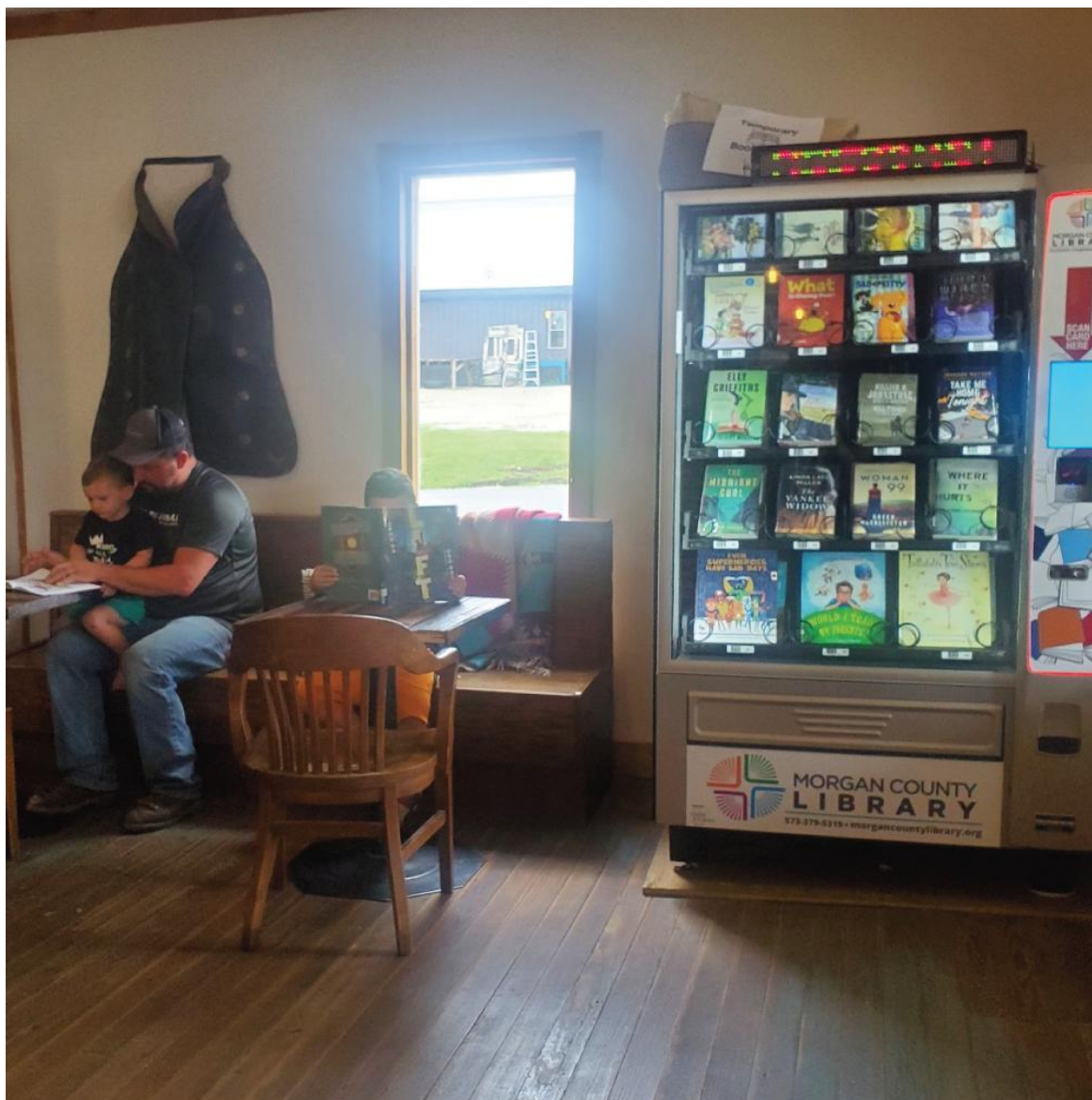
Библиотека для книговыдачи

библиотечным материалам – книгам, DVD, журналам, фильмам и т.п. – круглосуточно. Библиотека также имеет возможность подключения точки доступа Wi-Fi для обеспечения доступа к электронным материалам и необходимым общественным службам, что может помочь в сокращении цифрового неравенства и растущего недостатка в словарном запасе.