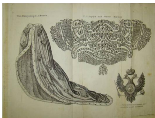
Коронационный альбом императрицы Елизаветы Петровны (Санкт-Петербург, 1744) из редкого фонда Национальной библиотеки Республики Карелия