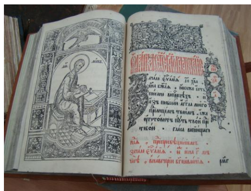
Рукописные и старопечатные книги из редкого фонда Национальной библиотеки Республики Карелия

В новой редакции закона введен единый хронологический критерий отнесения к книжным памятникам для отечественных и иностранных изданий. Теперь все экземпляры