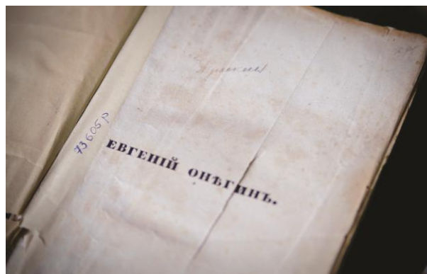
Пушкин А. С. Евгений Онегин (Санкт-Петербург, 1833) из редкого фонда Национальной библиотеки Карелии

К единичным книжным памятникам в соответствии с социально-значимыми критериями относятся следующие документы: