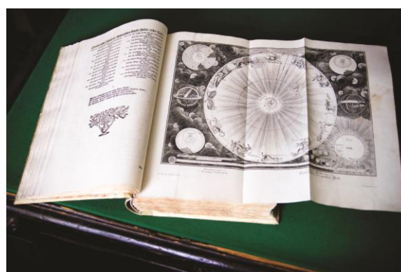
«Медная Библия» Иоганна Якоба Шейхцера (Аугсбург; Ульм, 1731) из редкого фонда Национальной библиотеки Республики Карелия

Законом к книжным памятникам отнесены все рукописные книги, созданные до XVIII века включительно.